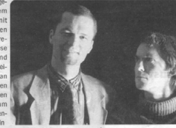
Zapp (links) und Zarapp freuen sich auf Vignetten & Co